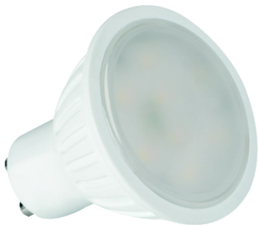
● Gu10 LED N 4W