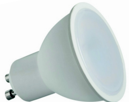
● GU10 LED 8W ● Gu10 LED N 8W