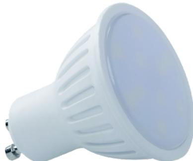
● Gu10 LED N 6W